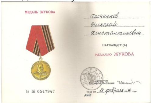
- Медалью «Жукова»