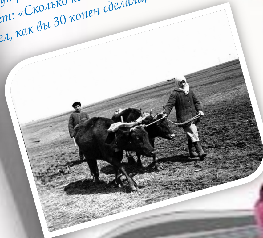
Труженицы тыла-жительницы с.Половинного