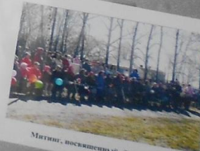
Митинг, посвященный Дню Победы

Прошла война, прошла страда, Но боль взывает к людям: Давайте, люди, никогда Об этом не забудем. Пусть память верную о ней Хранит, об этой муке, И дети нынешних детей, И наших внуков внуки... Затем, чтоб этого забыть Не смели поколения. Затем, чтоб нам Счастливей быть,