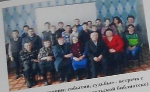
«Правда истории: события, судьбы» – встреча с репрессированными. (урок в сельской библиотеке)