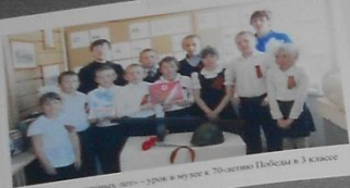
«Счастливые незнакомые люди» – урок и музей к 70-летию Победы в 3 классе