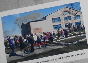
Возложение венков к монументу «Скорбящая мать»

Прошла война, прошла страда, Но боль взывает к людям: Давайте, люди, никогда Об этом не забудем. Пусть память верную о ней Хранит, об этой муке, И дети нынешних детей, И наших внуков внуки... Затем, чтоб этого забыть Не смели поколения. Затем, чтоб нам Счастливей быть,