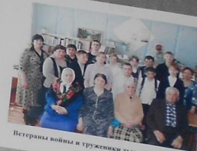
Ветераны войны и труженики тыла на встрече со школьниками