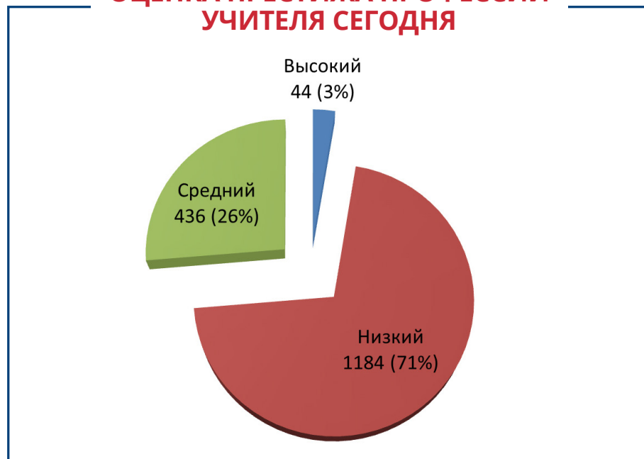
ОЦЕНКА ПРЕСТИЖА ПРОФЕССИИ УЧИТЕЛЯ СЕГОДНЯ