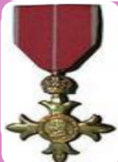
Орден Британской империи (Великобритания)