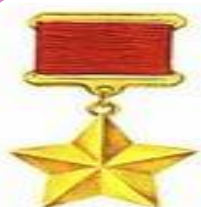
Медаль Золотая Звезда