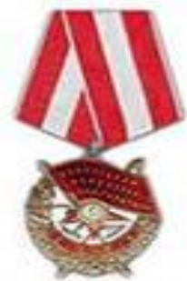
три ордена Красного Знамени