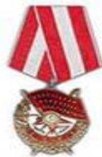
три ордена Красного Знамени