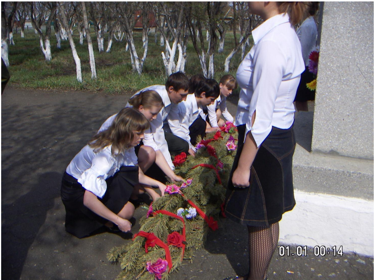
Традиционное возложение гирлянды славы от выпускников школы.