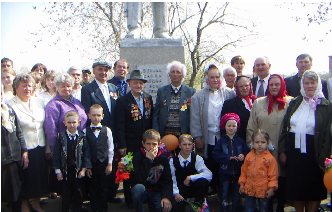
9 Мая у памятника собираются вместе четыре поколения.