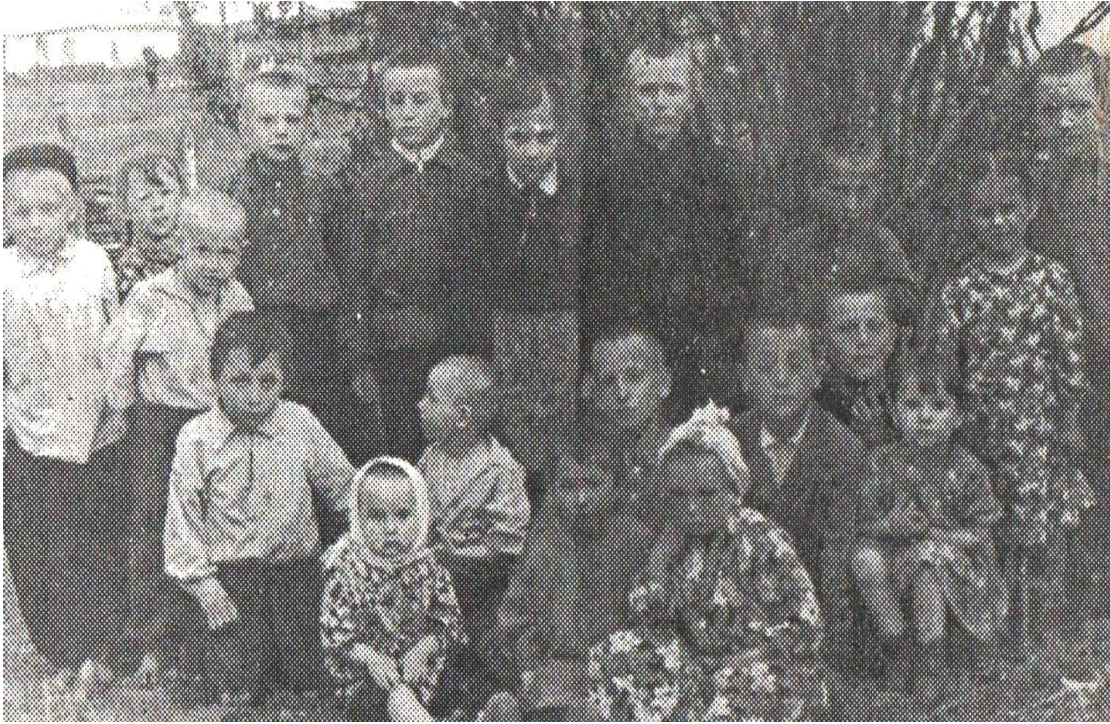
Веселокутская детвора: середина 40 -х годов.