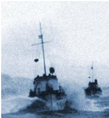
Катер СК – 37

Вас судьба не баловала чудом. Всё прошли Вы: Голод, смерть и страх. Очень многих вывели Вы в люди, Получив награду - седину в висках. Без остатка отдавали своё сердце, душу, А порою - свою жизнь. Скольким детям подарили детство, Грудью их от пули защитив. А сколько вы потом повоевали, Чтоб посеять разум, доброту, Чтобы показать дорогу к свету, Уничтожить без остатка тьму. Поверьте нам: Мы будем Вас достойны. Всё, всё, что Вами сделано, не зря.