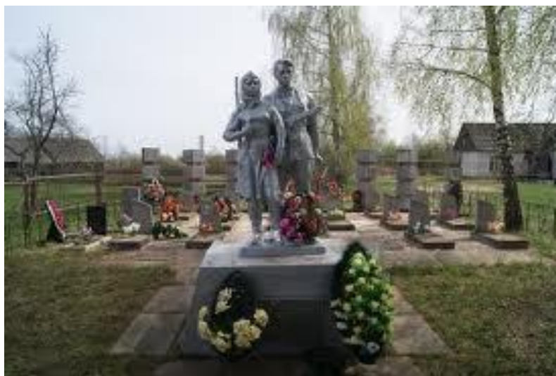
Памятник погибшим партизанам в деревне Шалахово – место захоронения моего дяди.