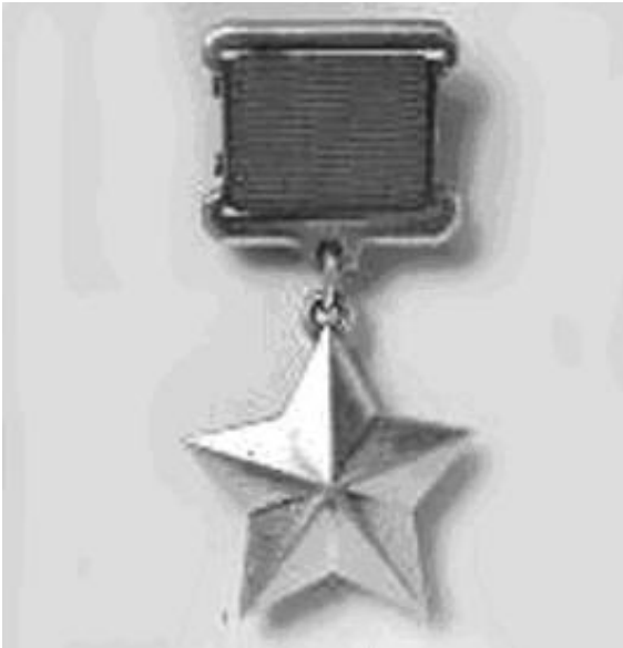
"Золотая Звезда" Героя Советского Союза.