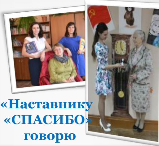
«Наставнику «СПАСИБО» говорю