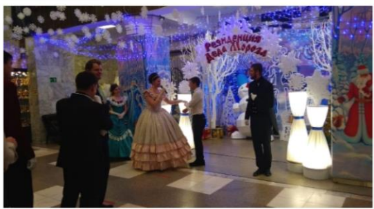
Традиционный ежегодный Бал молодых педагогов