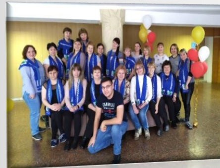
Футболки, кепки, шарфы с профсоюзной символикой