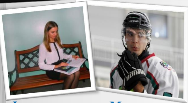
Фотоконкурс «Молодое лицо Профсоюза»