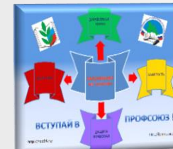
Коврики для мыши