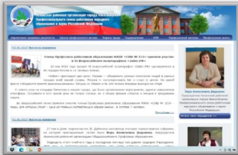
Сайт - lenpro.nios.ru