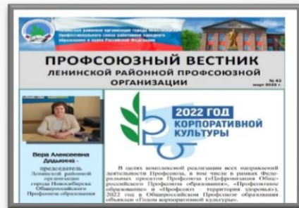
«Профсоюзный вестник» (ежеквартально)

«В завтрашний день можно смело смотреть, если такую поддержку иметь.»