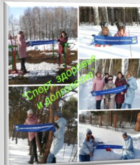
Выездные мероприятия, конкурсы, игровые программы

«Хочешь добиться успеха в делах, Будь в профсоюзе в первых рядах!»